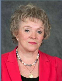
ELZBIETA MORGAN CHAIR