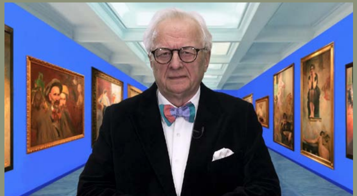
Leszek Wyczolkowski , Artist, Painter; Author of the TV program "History of Polish painting"